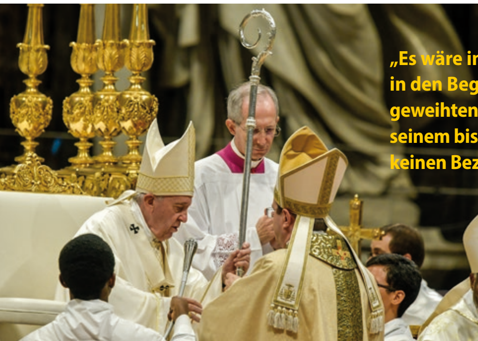
Papst Franziskus übergibt Paolo Rudelli den Bischofsstab – Bischofsweihe im Petersdom am 4. Oktober 2019.

„Es wäre in der Tat ein Widerspruch in den Begriffen selbst, wenn man einen geweihten Bischof annähme, der in seinem bischöflichen Weihecharakter keinen Bezug zur Leitung der Kirche hätte.“