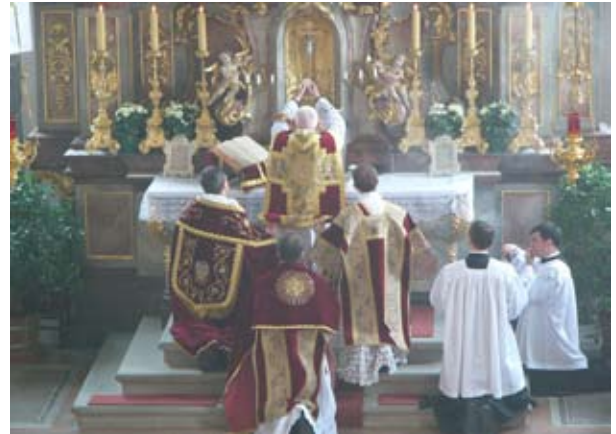
Das Hochamt in Maria Thann

ist, schon viele Jahre in Deutschland - und seit Anfang der 90er