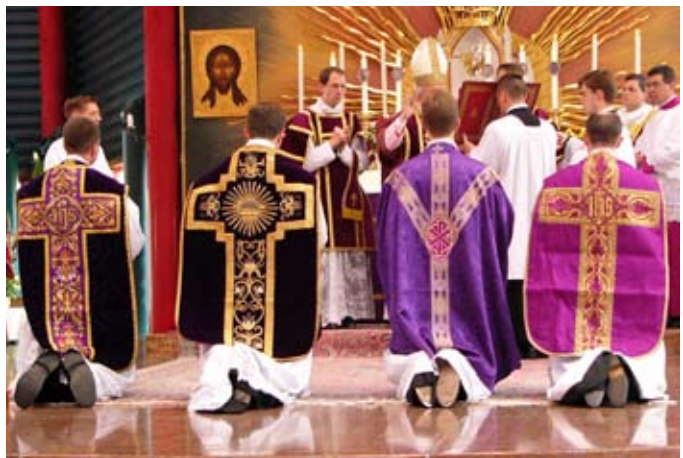
Die Neupriester gegen Ende der Weihemesse

Priester diese ihre Vollmacht auch aus, indem sie zusammen mit dem Kardinal alle Gebete der heiligen Messe sprachen und zusammen mit ihm das heilige Opfer darbrachten.