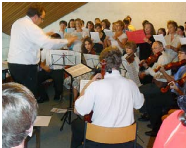
Chor und Orchester auf der Empore

Endlich war es soweit: am Sonntag, dem 29.Juni, Fest der hl.Petrus und Paulus begann um 10.00 Uhr das Primizamt, an dem ungefähr 430 Gläubige teilnahmen.