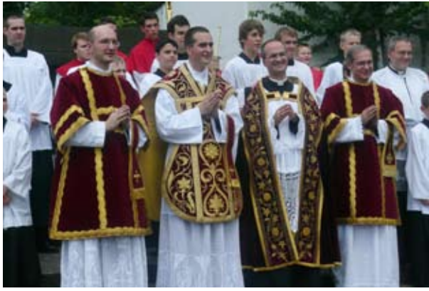
Nach dem Primizamt vor der Kirche St. Albert